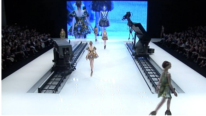
الصورة(38) منظر عام لخشبة العرض ويظهر عليها الكاميرتان والقضبان وشاشة الخلفية.

الأمر في الأساس مرجعه الجهد الكبير الذي يبذله مكوين وفريقه لإخراج عرض يتم عرضه لمرة واحدة، يشاهده 300 شخص، عروض مكوين قطع مسرحية مذهلة، يتم فيها بذل جهد كبير، فبينما تعرض الأعمال المسرحية للعديد من المرات يتم عرض الموضة المبهر لمرة واحدة فقط، من هنا جاءت فكرة المصور أن يتم نشر العرض على شريحة أكبر من المشاهدين، وخاصة أن مكوين لا يميل أن يملئ صفوفه بالشخصيات المشهورة والبارزة،